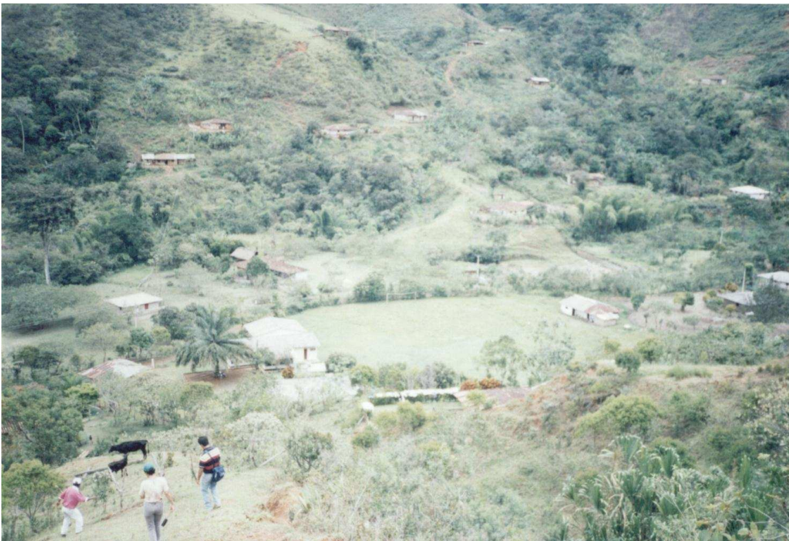
Escuela en alto riesgo. El Silencio. Municipio de Buenos Aires. Geosig Ltda.. 2000