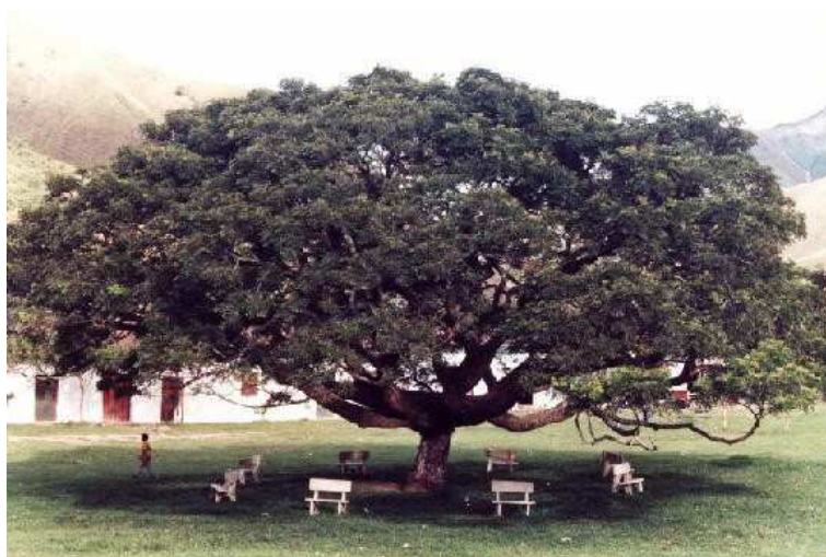
Parque del Asentamiento Nucleado de Puerto Valencia

En inmediaciones de Puerto Valencia existen varios cerros tutelares que son un potencial paisajístico notable. Cuenta con una estructura predial ortogonal en torno a un espacio central, actualmente una gran parte de las edificaciones que hacen parte de su paisaje original están en un alto grado de deterioro, de igual modo presenta un número reducido de habitantes en su contexto, y un número elevado de edificaciones para estos pocos habitantes.