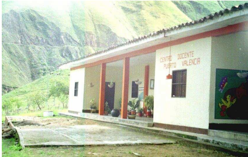
Centro Docente Puerto Valencia

El cementerio es un equipamiento que se deteriora continuamente con el paso del tiempo. Muchas de las actividades culturales han desaparecido, la procesión al Cerro de la Cruz ya no se realiza y no representa ninguna importancia para los habitantes.