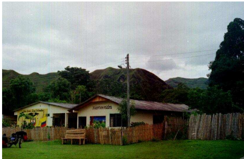
Escuela Rural Mixta Segovia

Segovia tiene como particularidad una vía de acceso vagamente definida desde la vía intermunicipal Inzá- Belalcázar, que pasa desapercibido al tránsito vehicular.