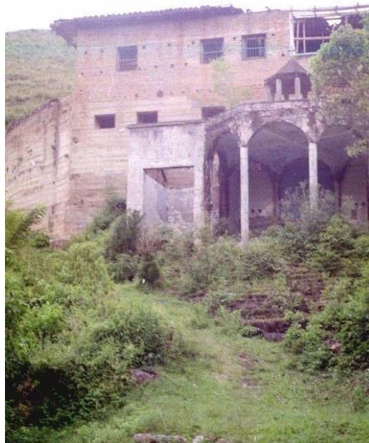
Templete – Puerto Valencia

El numero de habitantes se reduce constantemente puesto que esta población no brinda oportunidades laborales, se propicia la migración en busca de mejores expectativas de vida en otros territorios.