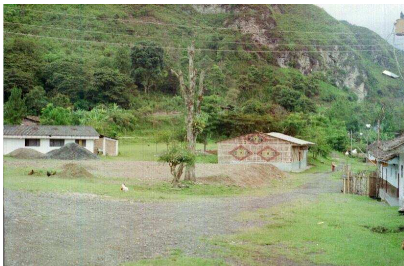
Asentamiento Nucleado San Francisco

El poblado de San Francisco esta ubicado a pocos minutos de la Cabecera Municipal, tiene una estructura lineal donde la vía principal es la columna vertebral, con flujo vehicular constante por ser una vía de carácter nacional.