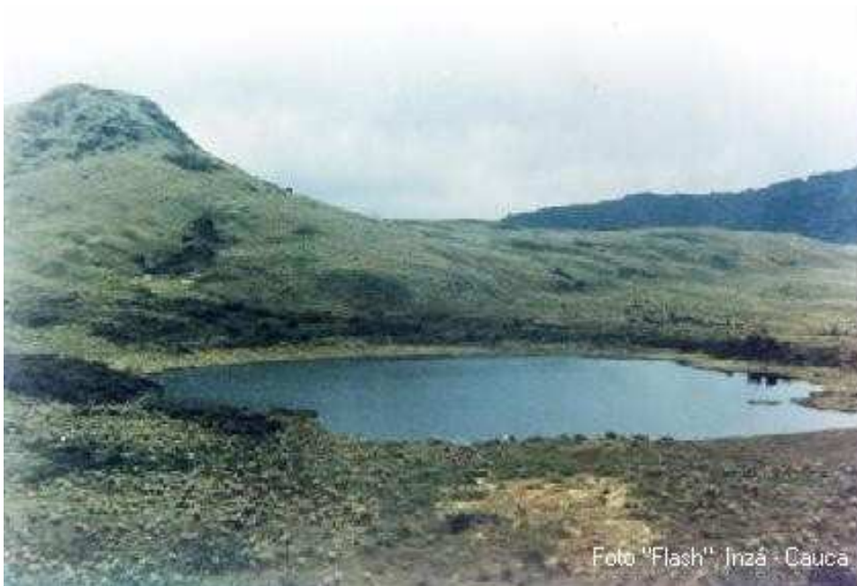
Páramo Guanacas – Las Delicias: Laguna de Guanacas