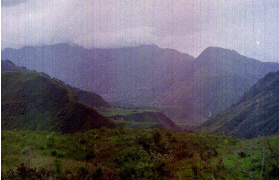
Zona de vida Sub Andina