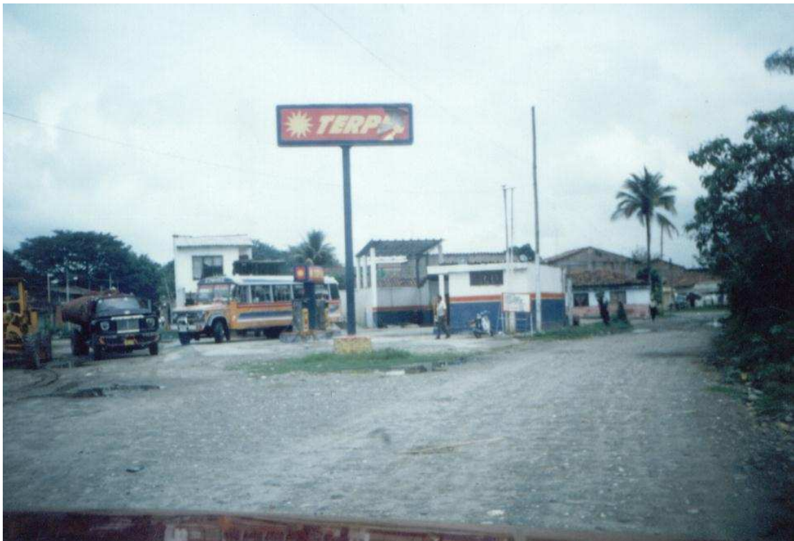
Panorámica entrada a la Cabecera Municipal. Municipio de Padilla