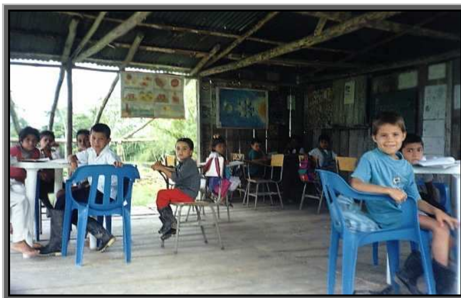
Foto 2. Escuela en la Vereda el Palmito, Yapurá.