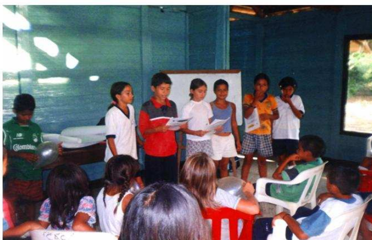
Foto 1. Taller organizado entre db Sig Geólogos Consultores y FUNAMBIENTE con los Niños pertenecientes a GAMA. Centro Agroforestal Guayuyaco, 2002

3.1.5 Educación No formal. En el Municipio de Piamonte, FUNAMBIENTE viene desarrollando dentro de su función social el proyecto GAMA (Grupo de Amigos del Medio Ambiente), el cual se desarrolla con 20 niños aproximadamente, del corregimiento de Miraflores. Los encuentros se hacen en el Centro Agroforestal Guayuyaco los días Miércoles y sábados. Las actividades de este grupo se centran principalmente en valorar, cuidar y respetar la naturaleza, también es un espacio que les permite incentivar una conciencia ciudadana, sentirse útiles e importantes, mantener vínculos de amistad y recrearse. El programa contempla la posibilidad de ampliar el número de integrantes y busca además vincular adolescentes con el fin de darles la oportunidad de ocupar su tiempo libre transmitiendo los conocimientos y reproduciendo las actividades de talleres de educación ambiental y siembra de árboles en las diferentes escuelas del municipio de Piamonte y así generar mayor impacto en la zona. (Informe de actividades Centro Agroforestal Guayuyaco. Funambiente. 2001) 2 (ver foto 1).