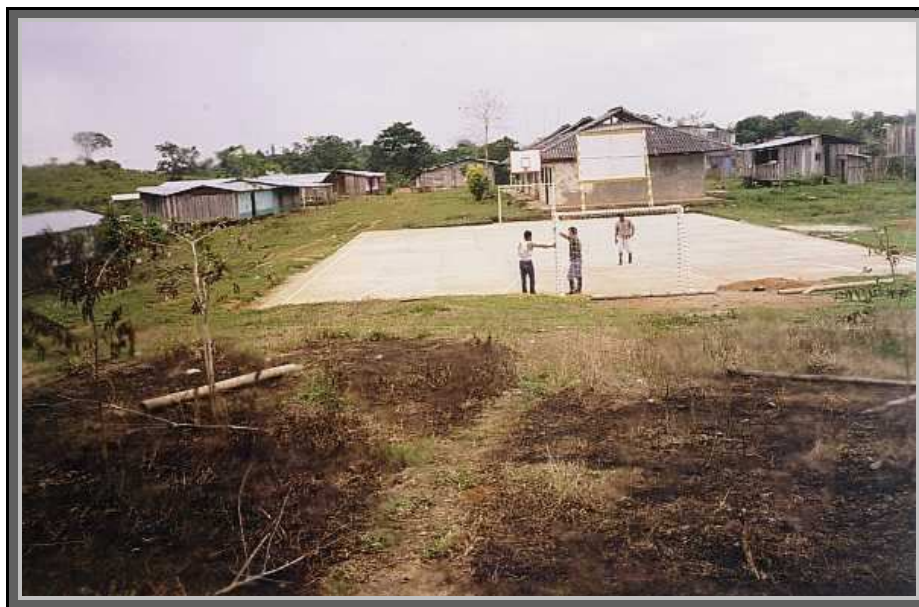
Foto 3. polideportivo para la practica de fútbol y baloncesto en el corregimiento de Yapurá. (foto Rodrigo Gómez).