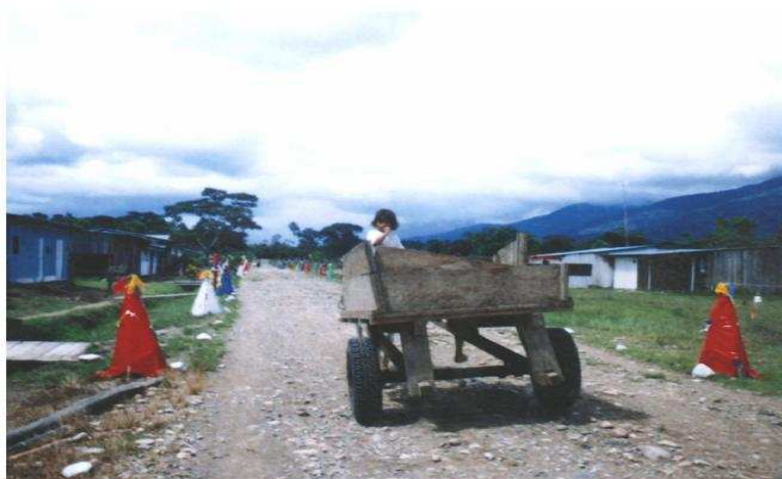
Foto 4. Celebración del Alumbrado, 7 de diciembre. Piamonte 2001

Por otra parte, cada año, tres días antes del miércoles de ceniza se lleva a cabo entre los indígenas ingas, la celebración del carnaval tradicional; en esta fiesta se conmemora la reconciliación y reencuentro entre los miembros de la comunidad, animada con música que se interpreta con instrumentos tradicionales, danzas autóctonas y vestuario especial. El hombre usa un camión de color blanco bordado en sus extremos, denominado "cusma". Las mujeres usan la "pacha", que es una prenda de color negro ajustada a la cintura con una faja o "chumbe", (pieza tejida en lana de colores vivos y con una simbología representativa) quedando a manera de falda y el "tupulle" o blusa de color negro ajustada a los hombros con gancho. Adicionan a este vestuario, tanto hombres como mujeres, collares de colores llamativos llamados "chaquiras" o pañuelo rojo para los hombres, en caso de no tener collares.