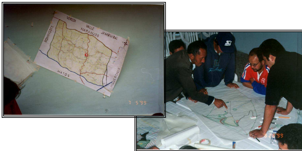
FOTO 1.1 Delimitación veredal por cartografía social.

Se lograron definir 6 corregimientos, la cabecera municipal, y 54 veredas. El Mapa 1 de división política se observa la distribución veredal, y en la Tabla 1, presenta el listado de estos en el Municipio de San Sebastián..